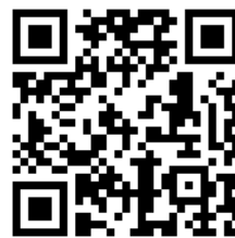
ダイバーシティ推進室 HP

毎年実施しているアンケート集計結果の比較分析を通じて事業計画に反映され、教職員のダイバーシティ推進、ワークライフ・バランス改善が図られるように努めます。