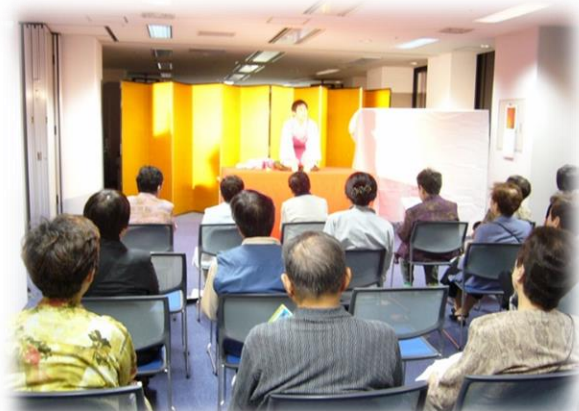
写真は、笑って健康教室のイメージです