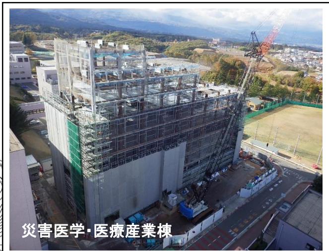
災害医学・医療産業棟

環境動態解析センター棟では、内外装の仕上げ工事と、電気・機械の設備工事を行っています。(写真は屋上部分)