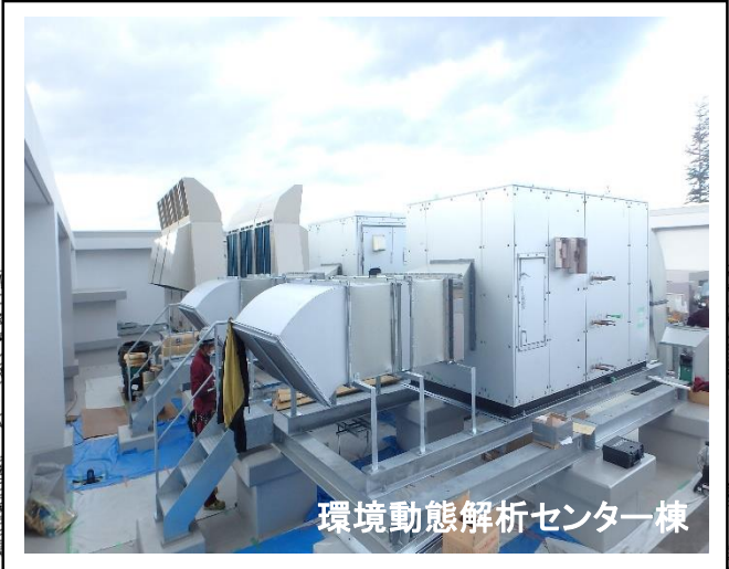
環境動態解析センター棟

環境動態解析センター棟では、内外装の仕上げ工事と、電気・機械の設備工事を行っています。(写真は屋上部分)