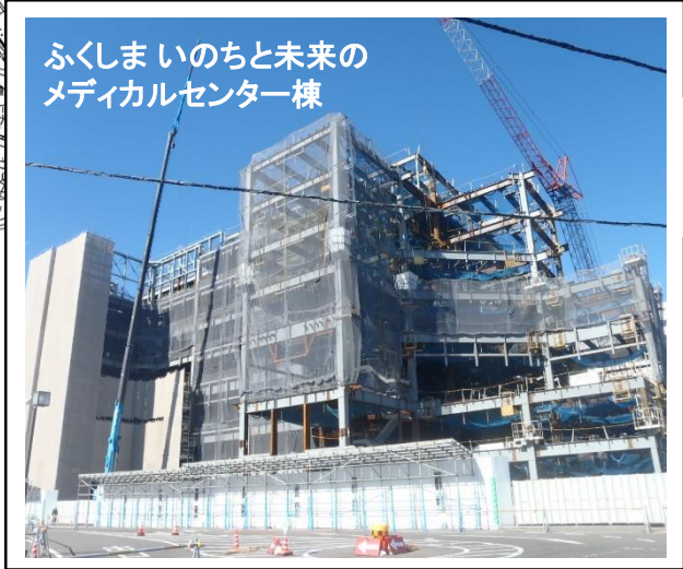
ふくしまいのちと未来のメディカルセンター棟