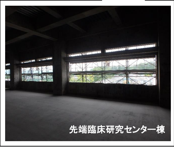
先端臨床研究センター棟

ふくしまいのちと未来のメディカルセンター棟では、1～7階部分の梁や柱となる鉄骨工事を行っています。