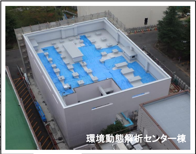
環境動態解析センター棟

環境動態解析センター棟では、内外装の仕上げ工事と、電気・機械の設備工事を行っています。