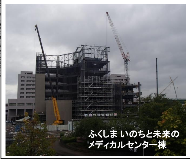
ふくしまいのちと未来のメディカルセンター棟