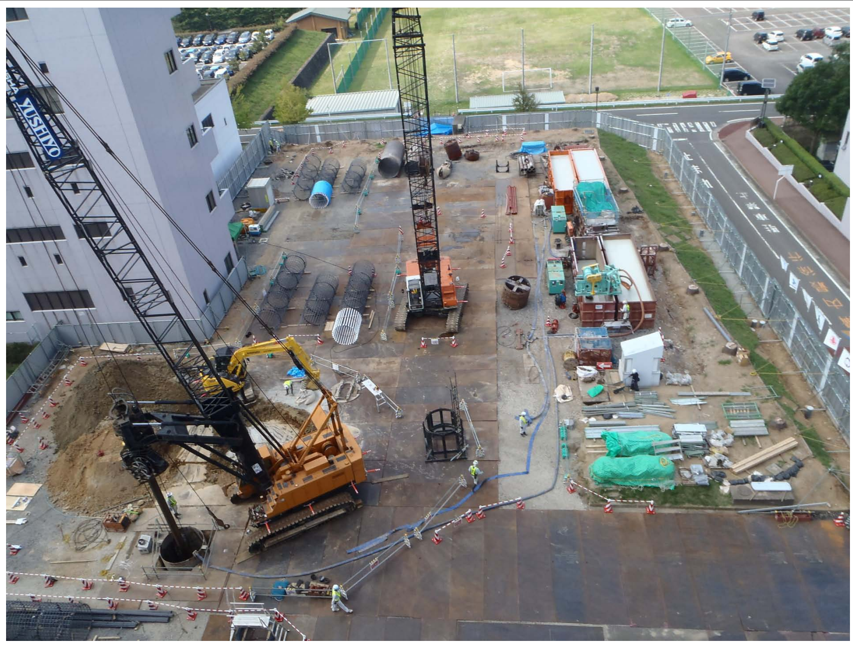
A棟の建設予定地では、杭打ち工事が始まりました。