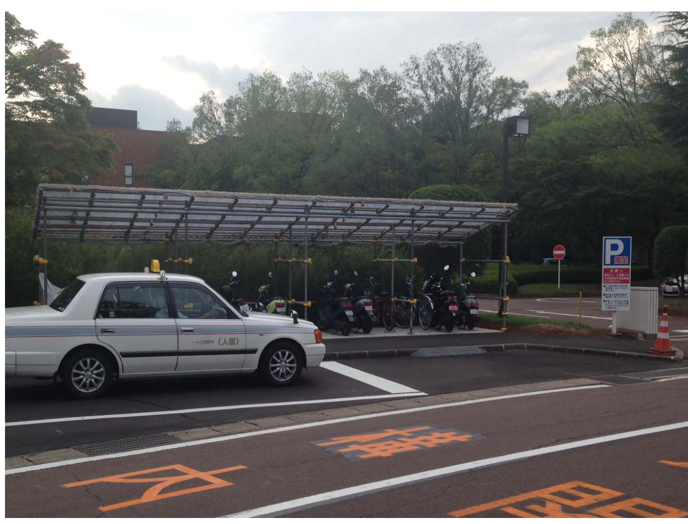
駐輪場の位置が変更になりました。