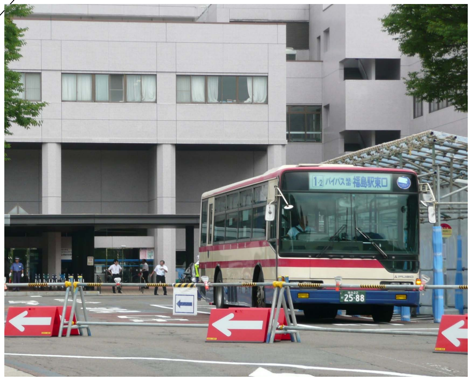
ロータリーの通行方法変更に伴い、バス乗降場が変更になりました。