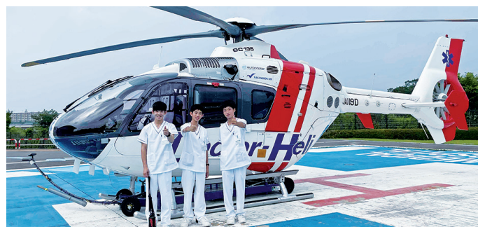
▲福島大学附属中学校のみなさん