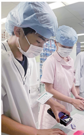
▲薬剤部での職場体験の様子

各職種の役割やチームワークの大切さについて学んでもらうため、看護部、臨床工学センター、放射線部、薬剤部等で体験活動をしていただきました。現場でなければできない貴重な体験をし、現場の第一線で働くスタッフとの関わりを通して、「医療現場の実態を詳しく学ぶことができた」