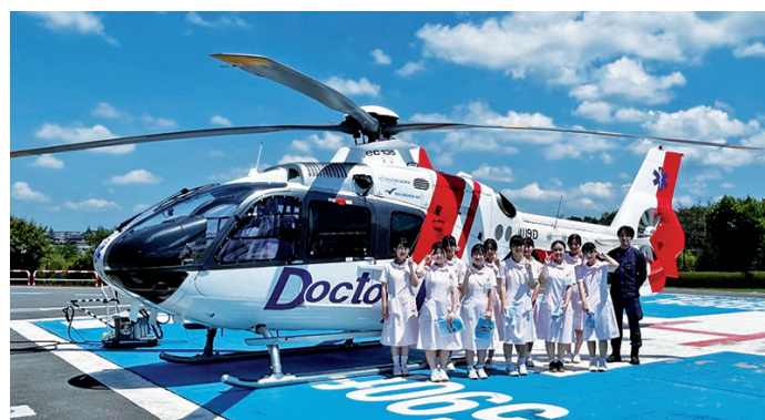
▲一日看護体験に参加した高校生のみなさん

福島県看護協会では、高校生を対象に「高校生の一日看護体験」事業を実施しています。この事業は、看護体験を通してより具体的な看護職のイメージを持つことにより、看護は、かけがえのない命を守り、人の心にふれることのできる感動ある仕事と感じ、看護への関心を高めることを目的に行われます。