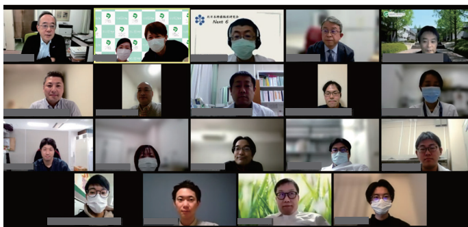
【ACiSTの定期ミーティング(オンライン開催)】

治療中に倦怠感、発疹、息切れなど少しでも気になる症状がありましたら、遠慮なく主治医・看護師・薬剤師にご相談ください。ACiSTはこれからも最新の知見を取り入れ、安全で質の高いがん医療の提供に努めてまいります。