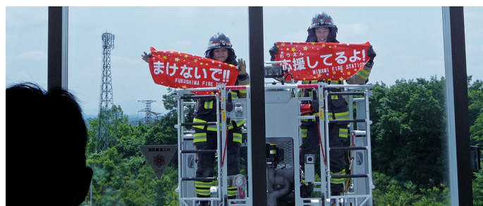
▲消防士の方がメッセージを送る様子

大変な入院生活のなか、たくさんの元気と勇気をもたらえました。福島南消防署のみなさんをはじめ、ご協力いただいたすべての方々へ、心から感謝いたします。本当にありがとうございました。