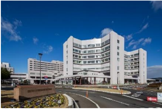
福島県立医科大学附属病院