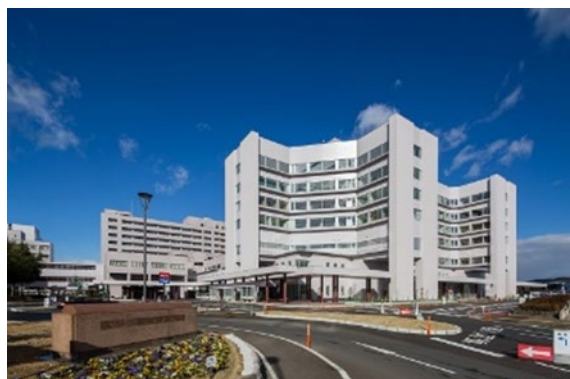
福島県立医科大学附属病院