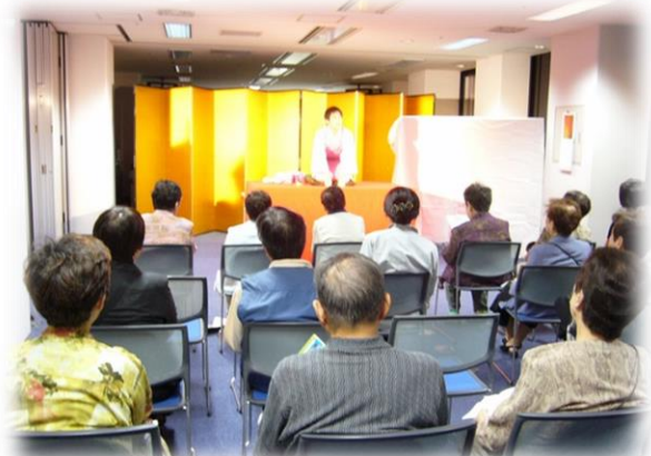
写真は、笑って健康教室のイメージです