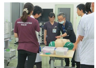
ステップ・アップ・セミナーの様子