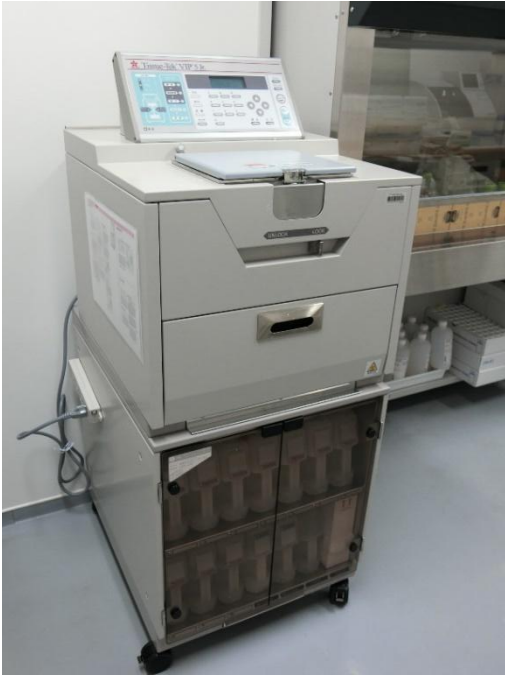
密閉式自動固定包埋装置