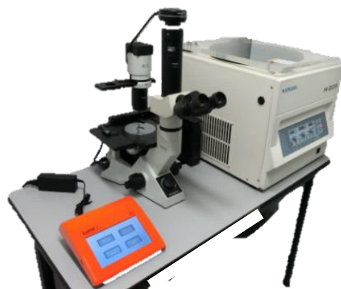
細胞測定・観察等培養機器