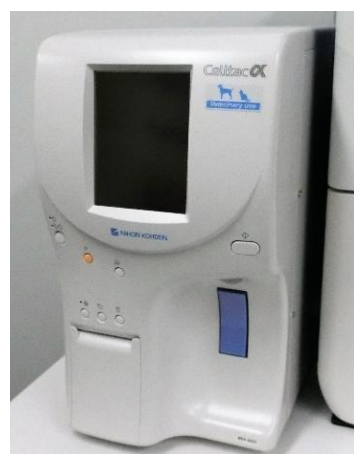
動物用血球測定器 MEK-6550