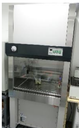
安全キャビネット