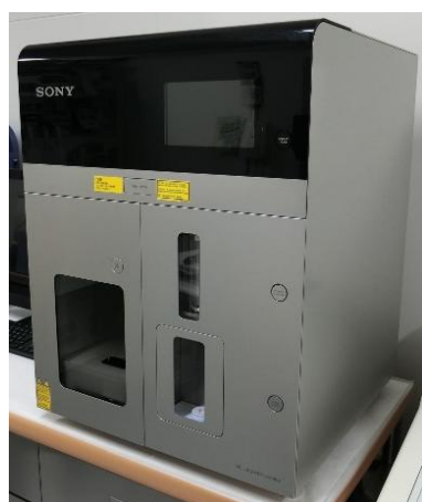
全自動高速セルソーター SH800S

細胞・蛋白・血球測定機器を有し、高精度な測定が可能。 薬効評価、副作用評価、至適投与量探索等の創薬支援が可能。