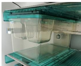
高性能アイソレーション式飼育システム