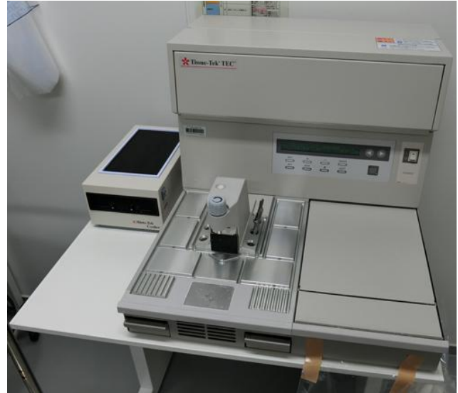
包埋ブロック作製装置