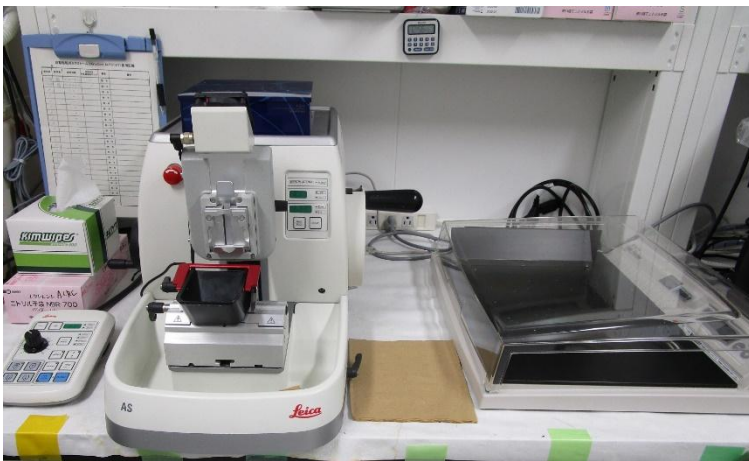
回転式ミクロトーム