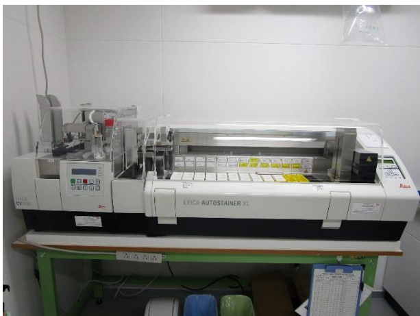
自動染色封入装置