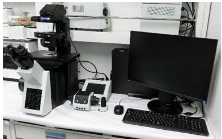
病理組織学的解析用 光・蛍光顕微鏡