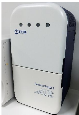
高性能ケミルミネセンス WSE-6100