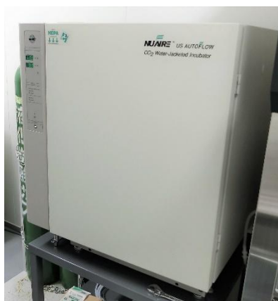
CO 2 インキュベーター

施設内で細胞を培養する環境が整っており、特定の病原菌がない環境(SPF)下での細胞・細胞移植動物モデル作成実験も行うことができる。