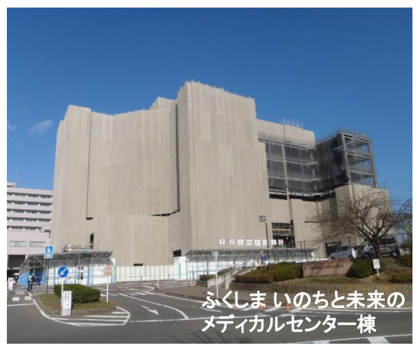
ふくしまいのちと未来のメディカルセンター棟