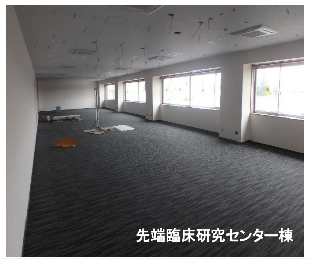
先端臨床研究センター棟