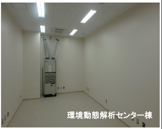
環境動態解析センター棟

環境動態解析センター棟では、内外装の仕上げ工事と、電気・機械の設備工事を行っています。