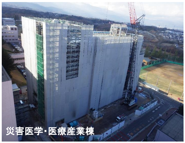
災害医学・医療産業棟

環境動態解析センター棟では、内外装の仕上げ工事と、電気・機械の設備工事を行っています。