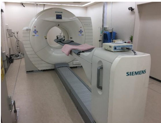
Siemens Biograph mCT

平成30年4月2日から、皆様からのご紹介によるPET/CT及びPET/MRI検査が電話1本で予約出来ます。