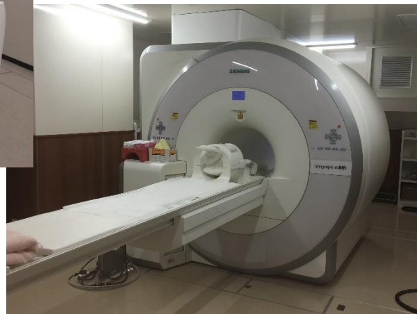
Siemens Biograph mMR