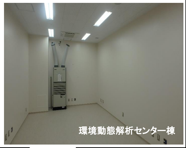
環境動態解析センター棟

環境動態解析センター棟では、内外装の仕上げ工事と、電気・機械の設備工事を行っています。