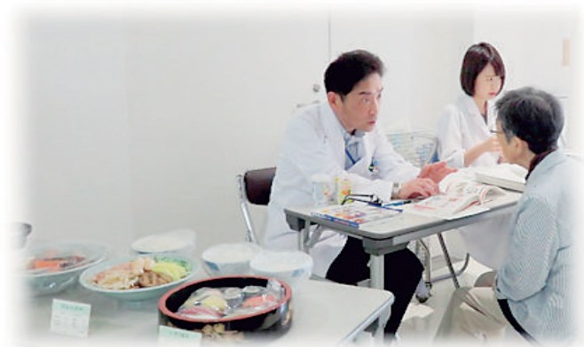
～栄養士による栄養指導～