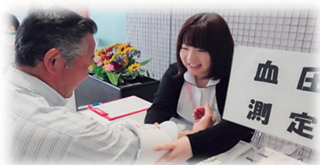
～看護師による血圧測定・健康相談～