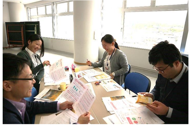
▲講義で習ったツールを駆使して、わかりやすく健康情報を伝える工夫を話し合いました

イラストやグラフはまず目につきやすいのか、注目する人も多かったようです。なかには「絵が現代っぽくない」なんて意見もありました。読む人に興味を持ってもらうためには、どんなイラストを選ぶのかもポイントになると思います。