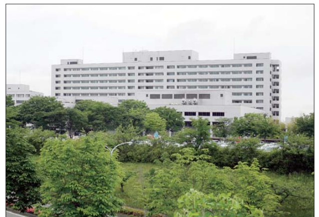
福島県立医科大学（福島市）