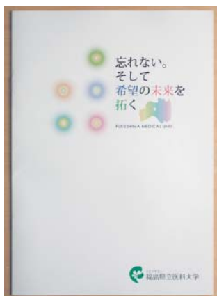
ふくしま国際医療科学センターの決意を記した小冊子表紙(2014年6月)