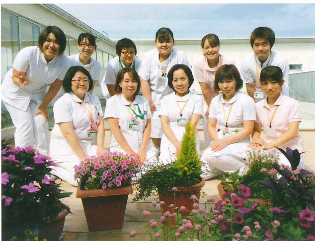
元気で、明るいスタッフが心からお迎えします。

希望する療養場所が自宅の場合、病状の安定化、家庭環境の改善を行うと同時に、訪問看護ステーションとの連携をとり、必要であれば訪問診療も考慮します。