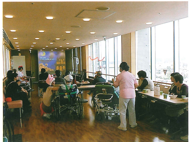
眺望が良く、広々としたデイルームでの様々な催し物