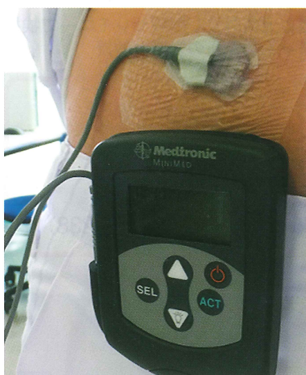
5分ごとに腹部皮下組織の組織間液のブドウ糖濃度を測定するCGMS

当然ながら、ほかの疾患に伴って生じる代謝疾患もあるため、原因となっている疾患はないのか、を内科総合的に検査を行い、ほかの疾患が見つかった場合は、その専門科に紹介します。