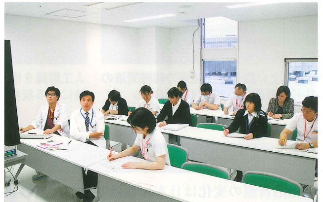
多職種によるカンファレンスの風景