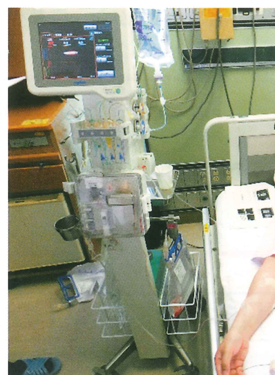
プログラムされた注入速度でインスリンを持続皮下注射するインスリンポンプ