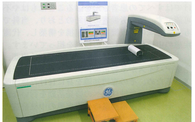
骨塩定量検査装置