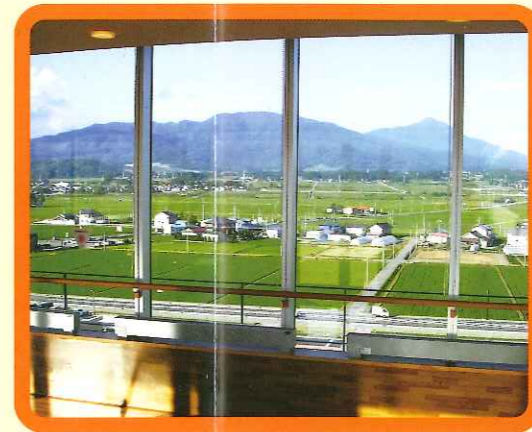
デイルームからの景色